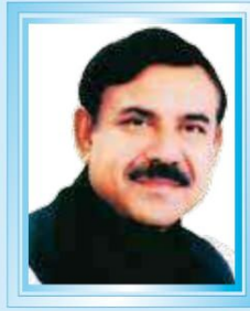
Mr. Shajahan Khan, M.P. Hon'ble Minister Ministry of Shipping Chairman