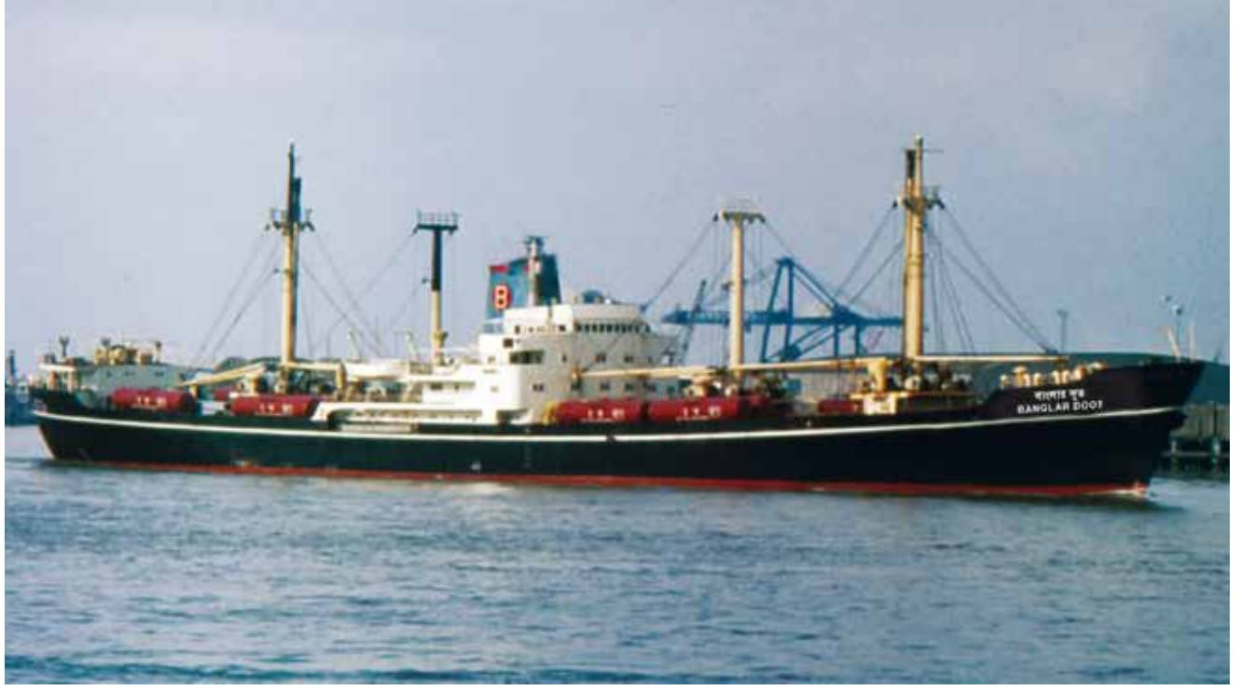
জাতির জনক বঙ্গবন্ধু শেখ মুজিবুর রহমানের প্রচেষ্টায় স্বাধীনতা-উত্তর বাংলাদেশে (১০-৬-১৯৭২ খ্রিঃ) বিএসসির বহরে সংযোজিত জাতীয় পতাকাবাহী প্রথম জাহাজ “বাংলার দূত”