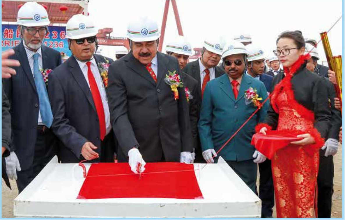
মাননীয় নৌপরিবহন মন্ত্রী জনাব শাজাহান খান, এম.পি কর্তৃক চীনে নির্মাণাধীন ছয়টি জাহাজের প্রথম জাহাজ 'এম. ভি. বাংলার জয়যাত্রা' এর শুভ Launching