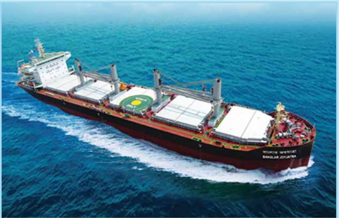
সমুদ্রে 'এম. ভি. বাংলার জয়যাত্রা'