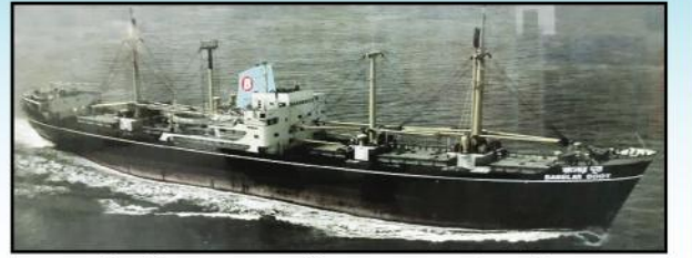
জাতির পিতা বঙ্গবন্ধু শেখ মুজিবুর রহমানের প্রচেষ্টায় স্বাধীনতার বাংলাদেশ (১০-০৬-১৯৭২ সাল) বিএসসি'র বহরে সংযোজিত জাতীয় পতাকাবাহী প্রথম জাহাজ "বাংলার দূত"।